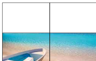
1/2 Doppelseite 420 x 135 mm