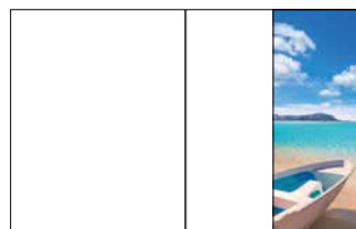
1/2 Seite hoch 105 x 270 mm