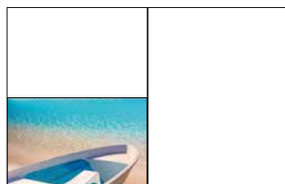
1/2 Seite quer 210 x 135 mm