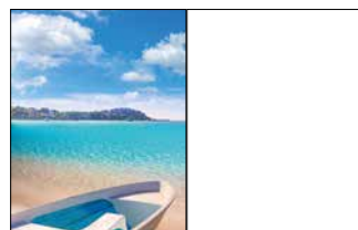
1/1 Seite 210 x 270 mm