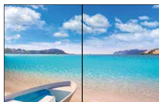
Panorama (Doppelseite) 420 x 270 mm