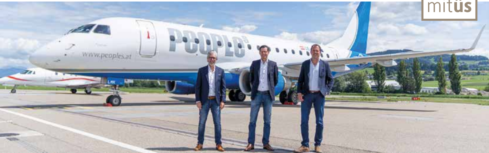
Vor dem People's Embraer E170 (von links nach rechts): die Geschäftsführer von Rhomberg Reisen, People's Air Group, High Life Reisen.

Zusammen mit den Reisepartnern High Life Reisen und Rhomberg Reisen bietet die Fluglinie People's auch dieses Jahr ein umfangreiches Angebot an Feriendestinationen ab St.Gallen-Altenrhein an. Die Reiseveranstalter Rhomberg Reisen (ab Seite 8) und High Life Reisen (ab Seite 12) haben attraktive Rundum-Sorglos-Pakete im Angebot. Wer nur den Flug buchen möchte, kann dies auch direkt bei der Fluglinie People's (ab Seite 4) tun.